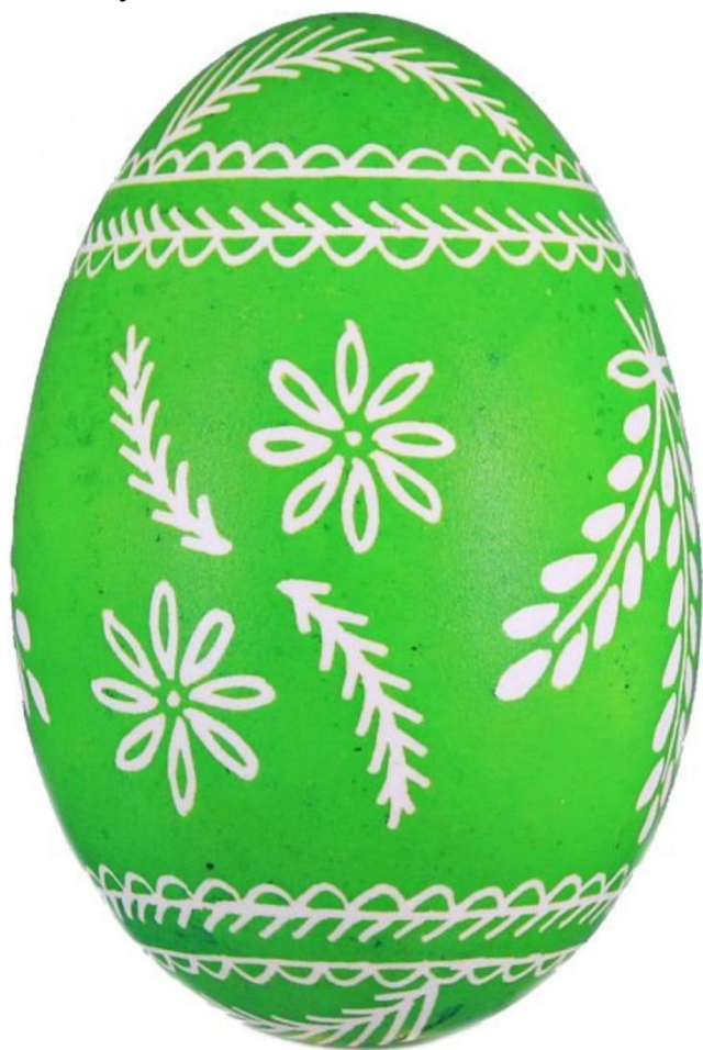
Załącznik nr 2